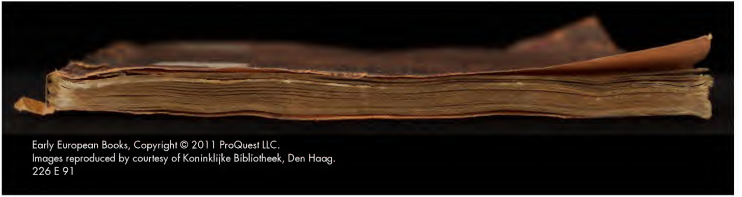
Early European Books, Copyright © 2011 ProQuest LLC. Images reproduced by courtesy of Koninklijke Bibliotheek, Den Haag. 226 E 91